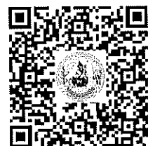
ตัวอย่างใบรับรองแพทย์